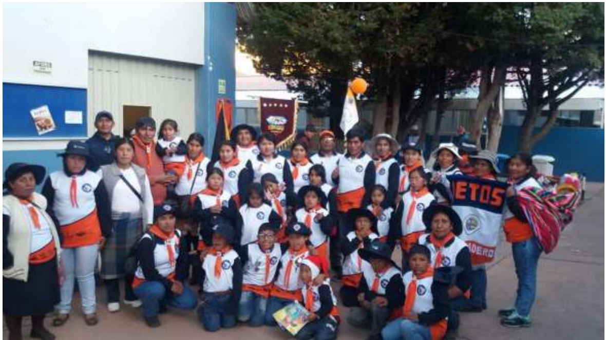
Red familiar del Club de Aventureros