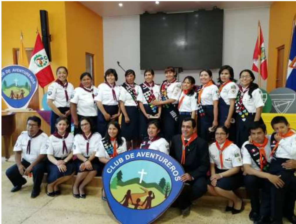
Día del Club de Aventureros