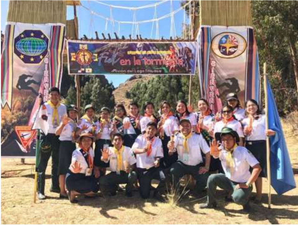
Participando en campamentos