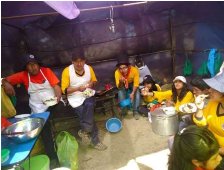
Participación en actividades