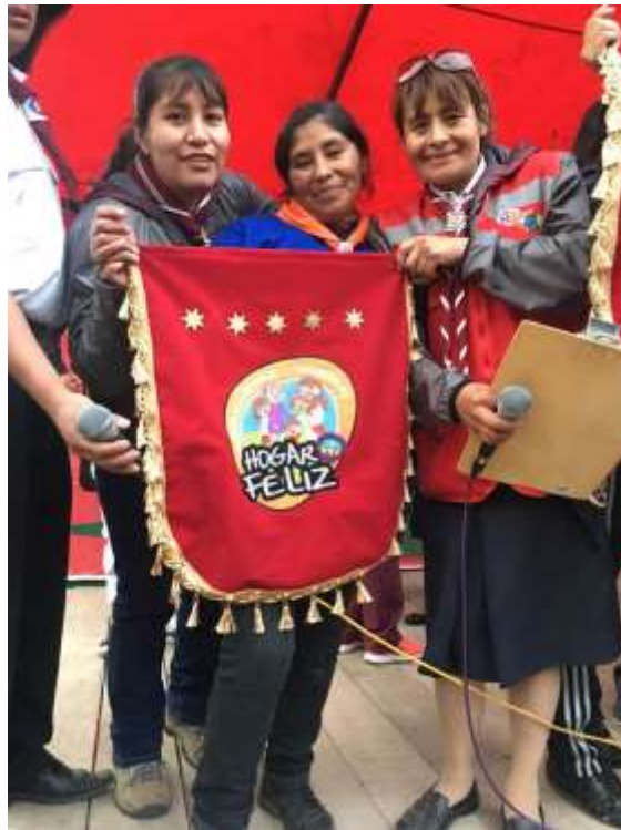
Premiación al Club de Aventureros por su participación